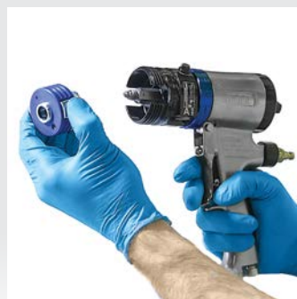
Drücken Sie die neue PC Materialpatrone auf die Mischkammer