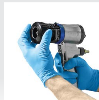
Luftkappe und Haltering installieren.